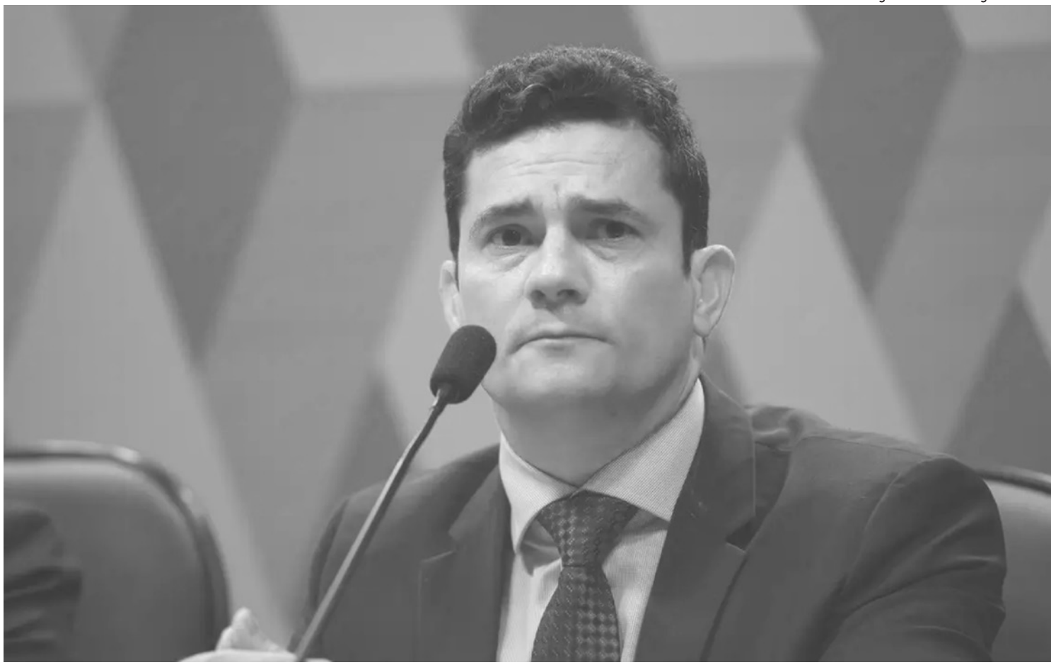
Em depoimento à Justiça Eleitoral, Moro negou que a pré-candidatura a presidente tenha impulsionado sua campanha ao Senado

O senador também está na mira do Conselho Nacional de Justiça (CNJ). Como mostrou o Estadão, ao mandar investigar o ex-juiz, o ministro Luis Felipe Salomão, corregedor nacional do CNJ, começa a pavimentar o caminho para uma possível cassação do mandato, com base no mesmo precedente que deixou Deltan Dallagnol inelegível.