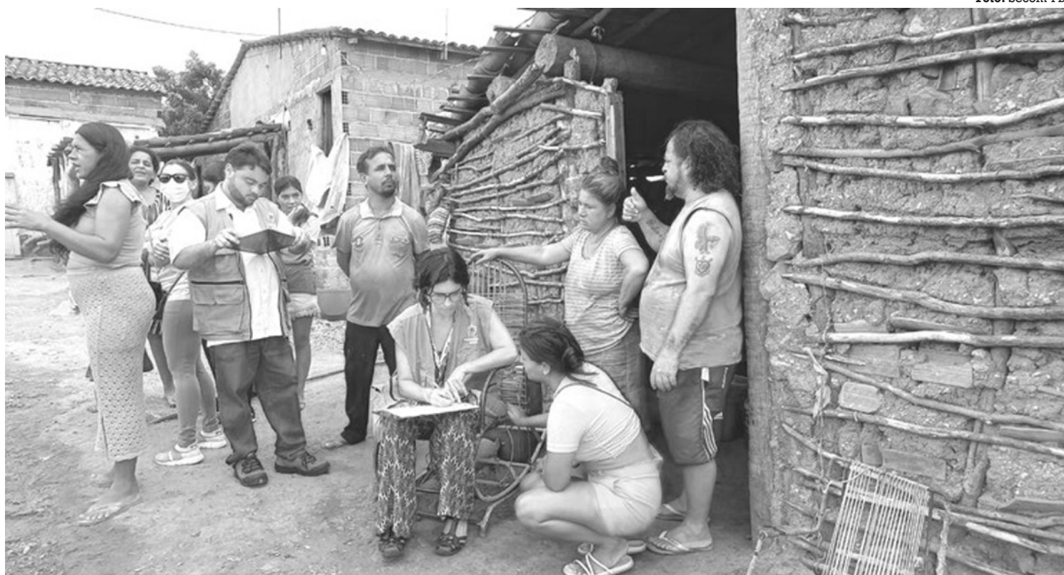
Durante a ação conjunta, foi observado que as 27 famílias da região vivem em situação de extrema vulnerabilidade social

Há um ano, essas famílias passaram por um processo de mudança, até que houvesse condições de moradia e acolhimento adequado para todos, proporcionando a possibilidade de reunião familiar na cidade de Marizópolis. Assim, surgiu a necessidade de atualização e inserção dessas famílias no Cadastro Único, uma vez que este se configura como a porta de entrada para acesso aos serviços, benefícios e programas sociais.