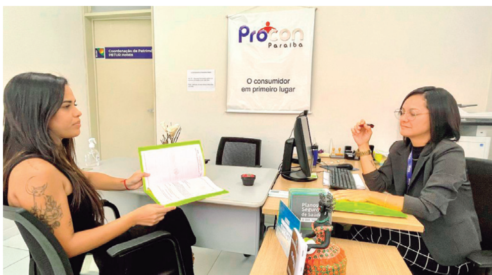
Local será espaço para a mediação de conflitos envolvendo as relações de consumo