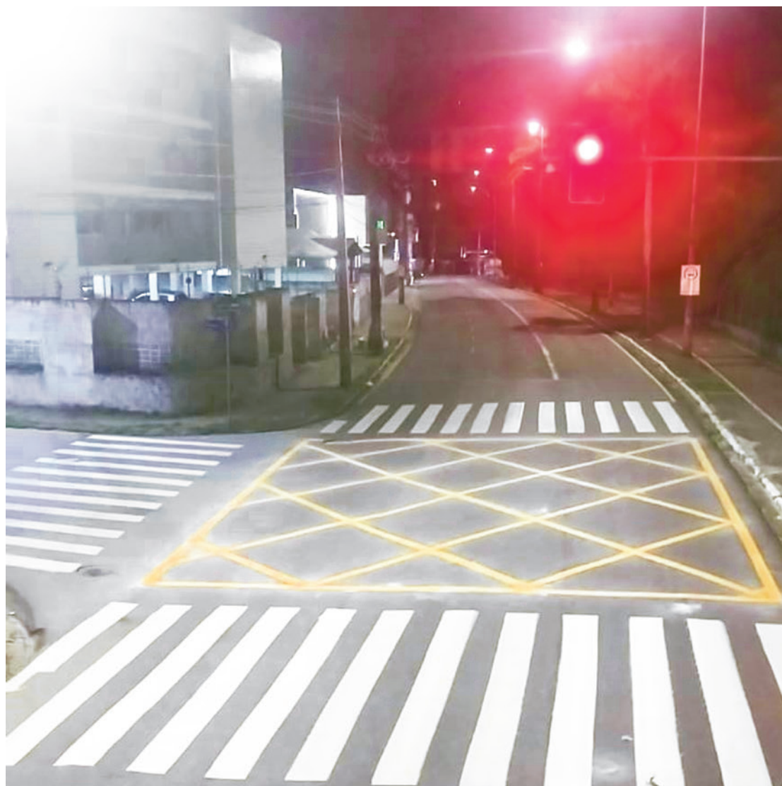
Revitalização de sinalização na Torre ocorreu nas avenidas Rui Barbosa (foto acima) e Pedro II

Os agentes de mobilidade também nos alertam quanto à necessidade de revitalizar pinturas na via e tro-