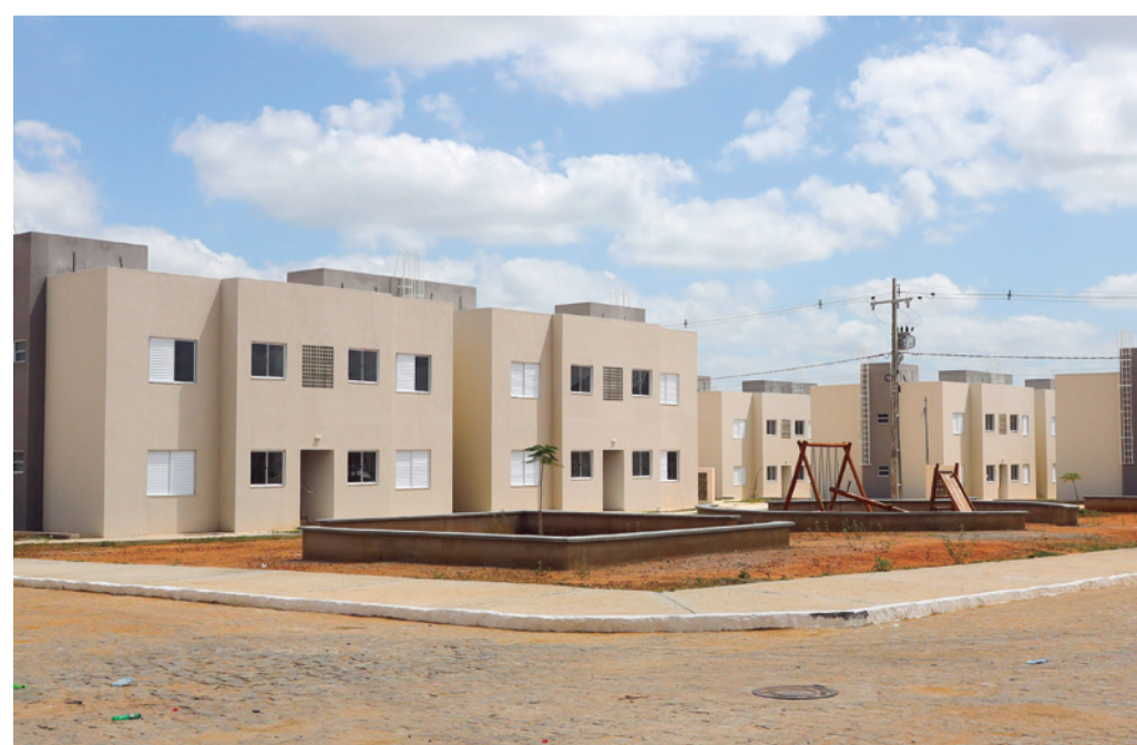
Condomínios inaugurados ontem oferecem infraestrutura completa em todos os blocos

A Cehap informou que as mudanças das famílias para seus respecti-