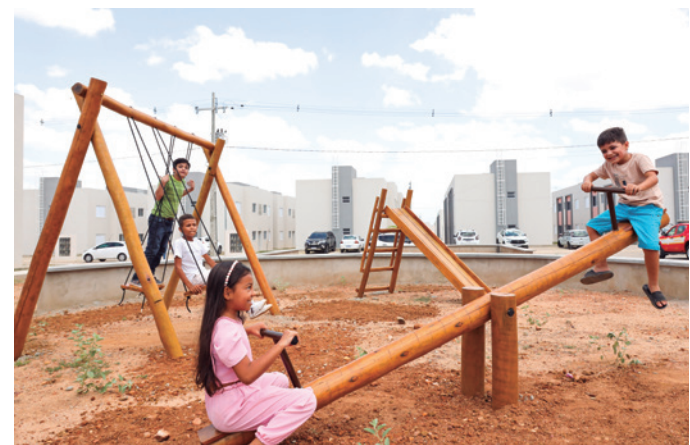
As crianças também têm local especial para diversão

A retomada do Programa Minha Casa, Minha Vida é a grande responsável pela entrega das chaves a essas famílias