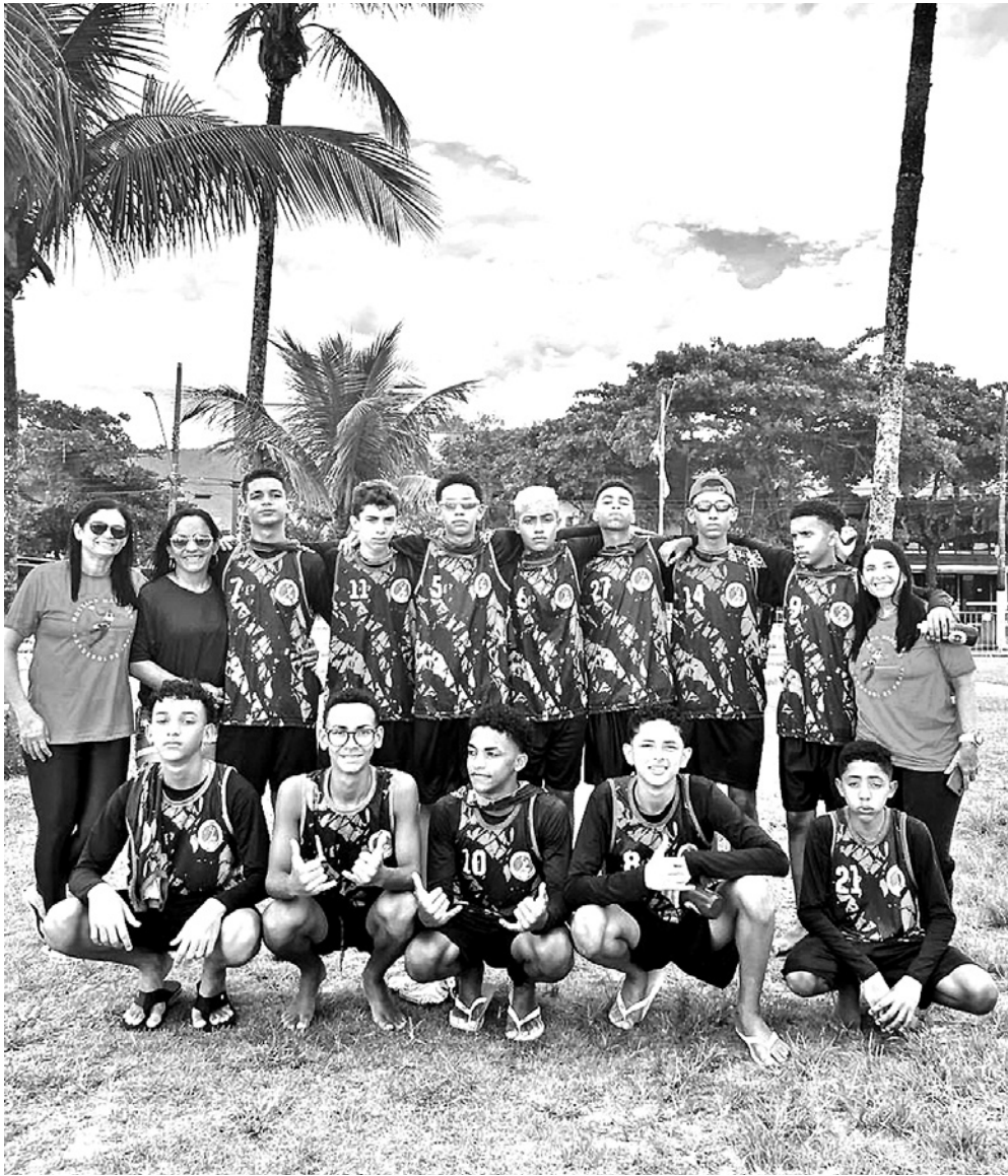
Os meninos perderam as duas primeiras partidas, mas superaram as dificuldades

A competição serviu para encerrar a temporada 2023, mas, também, para selecionar jogadores para a Seleção Brasileira que vai encarar as Olimpíadas da Juventude em 2026, que acontecem em Dakar, no Senegal. Os talentos paraibanos estão se destacando e podem compor o time que vai encarar esta que é a mais importante competição para adolescentes e atletas em formação no mundo.