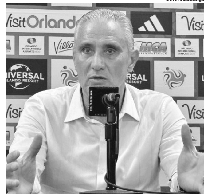
Tite mantém a escalação do time em segredo

A quinta rodada do Campeonato Carioca tem três partidas marcadas para amanhã. Em Conselheiro Galvão, às 15h30, o Madureira enfrenta o Boa Vista; no Estádio Municipal General Raulino de Oliveira, o Volta Redonda recebe o Audax e, às 21h30, no Estádio Luso-Brasileiro, na Ilha do Governador, o Fluminense enfrenta o Bangu.