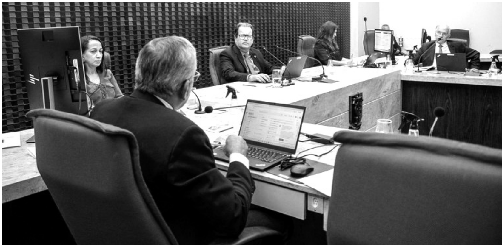
Os conselheiros da 2ª Câmara do TCE fizeram ressalvas, ontem, na aprovação de algumas contas, como foi o caso da Casa Legislativa de Sapé