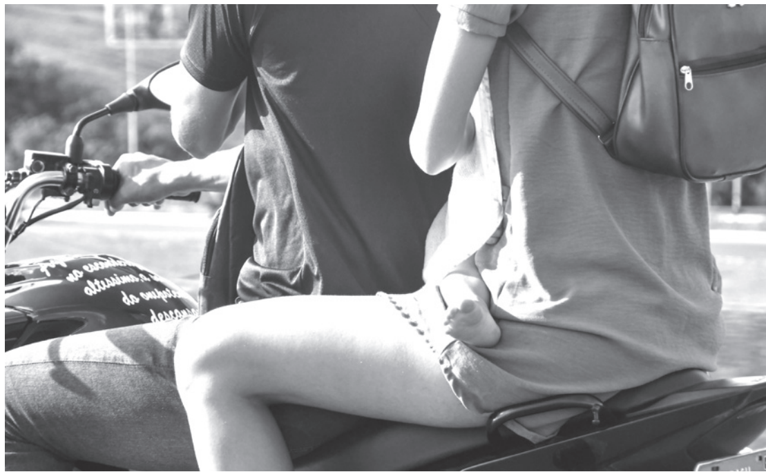
O tamanho da responsabilidade