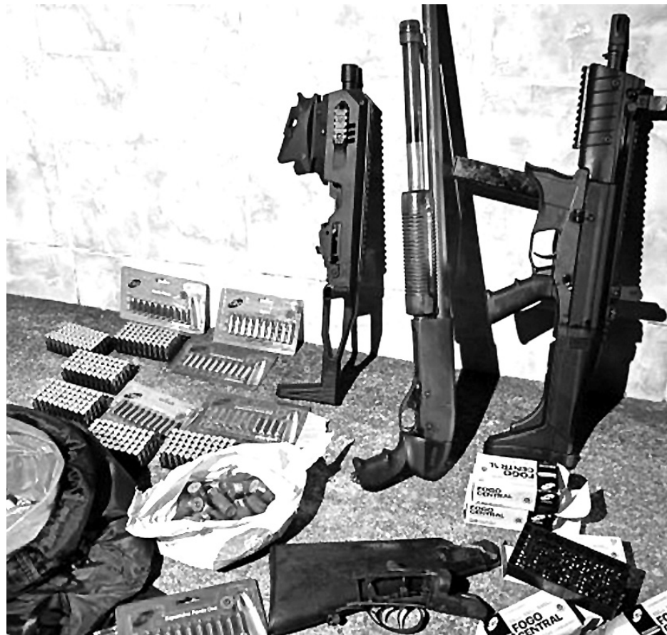
O material encontrado pela polícia foi levado para a Central de Polícia

O homem preso foi encaminhado a uma unidade prisional, onde ficará à disposição do Poder Judiciário.