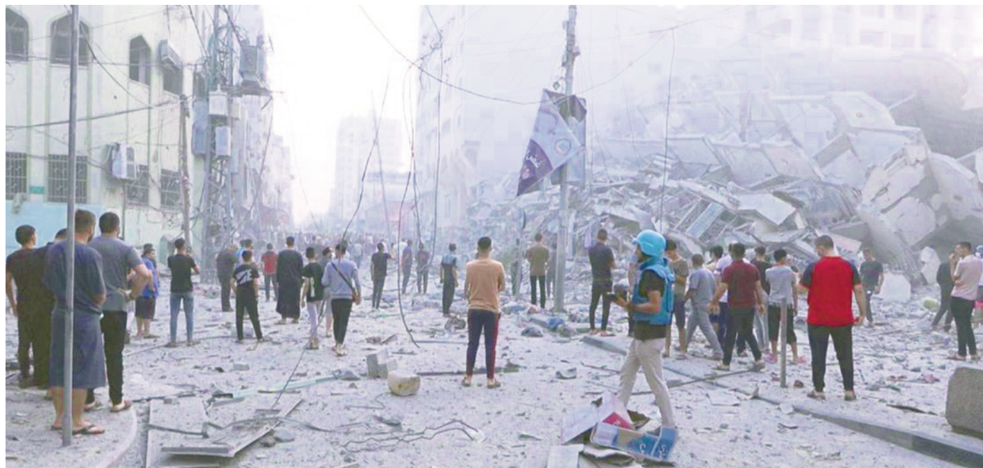
Forças israelenses continuam os bombardeios na Faixa de Gaza, enquanto não é aprovada uma proposta de cessar-fogo na guerra