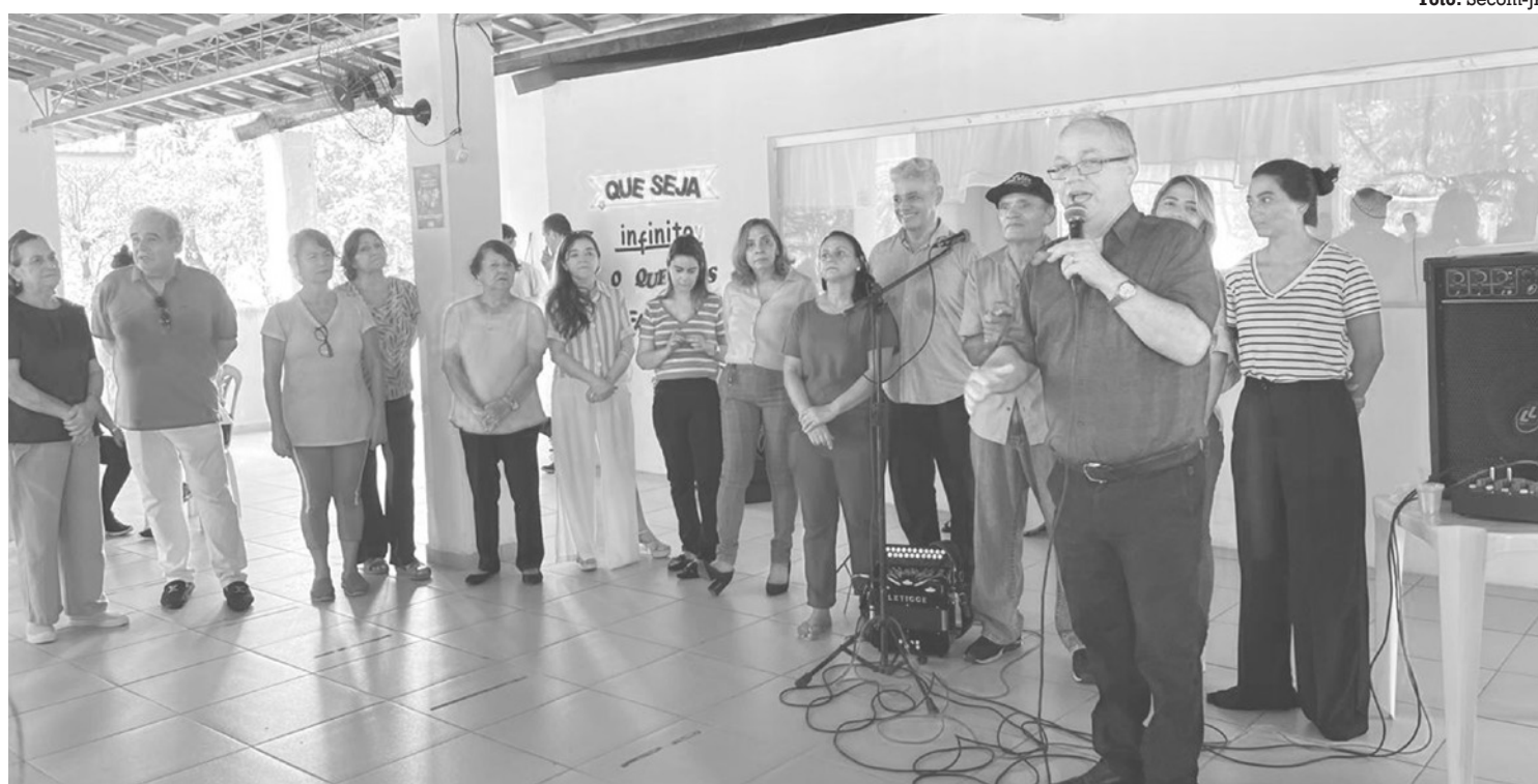
Abertura do calendário de atividades 2024 contou com apresentação de banda de forró e discurso de acolhida da equipe do Centro

Segundo ela, a SES já vem trabalhando e investindo muito forte na média complexidade com a parte de policlínicas.